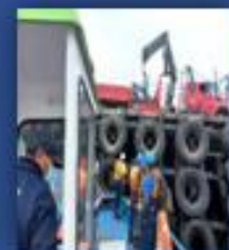
EMBARQUE DE TRABAJADORES DIAMANTE (SUPERVISADO POR SSO.)