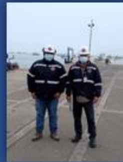
SUPERVISION MUELLE CENTENARIO "PD DIAMANTE"