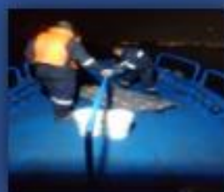
APOYO, EVACUACION DE VIGILANTE