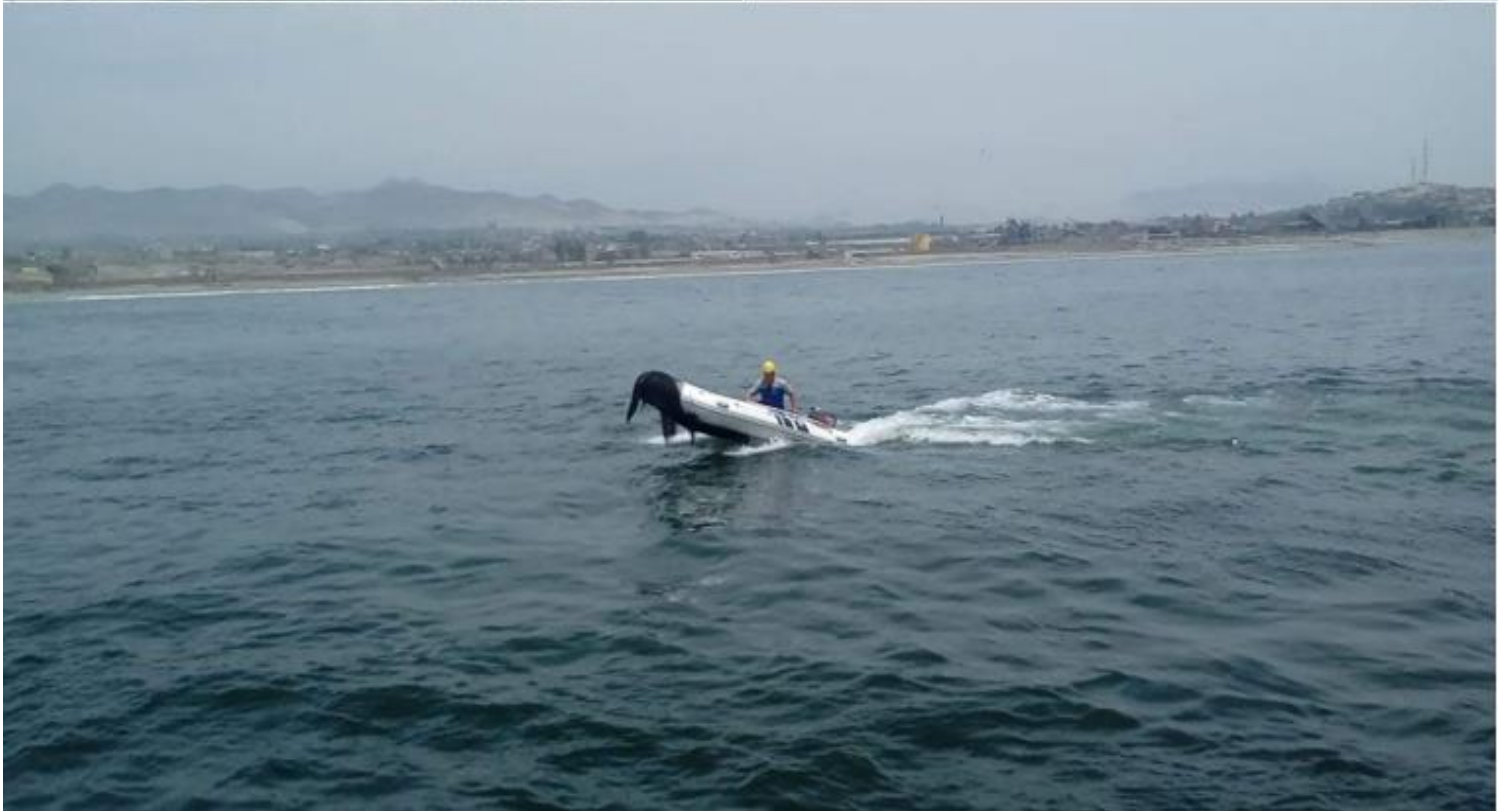
Supervisión Marítima: Ronda con botes