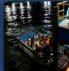
OPERACIONES, MANIOBRAS DIURNA Y NOCTURNA (EMBARQUE Y DESEMBARQUE DE MATERIALES)